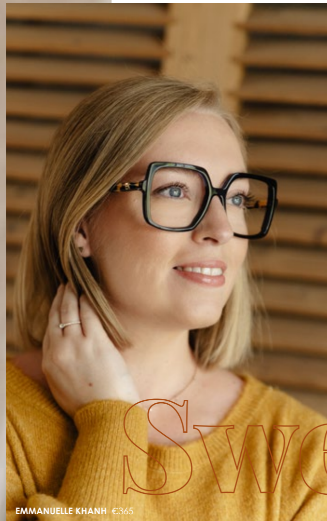
EMMANUELLE KHANH €365

Combineer deze opvallende look met een chunky knit & je kan de deur uit!