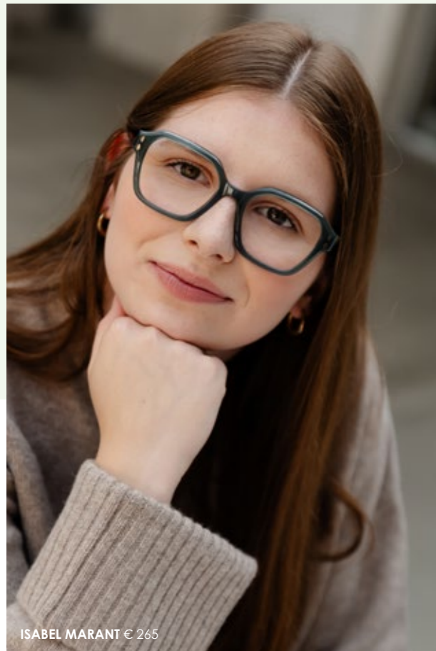
ISABEL MARANT € 265