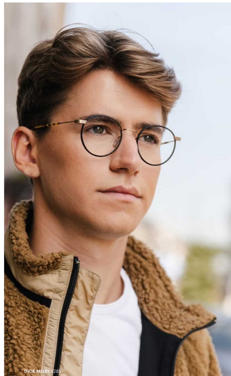
DICK MOBY €285

Daarnaast zijn de brillen van Ralph Lauren en zonnebrillen van onze laatste aanwinst Etnia Barcelona duidelijk al een favoriet!