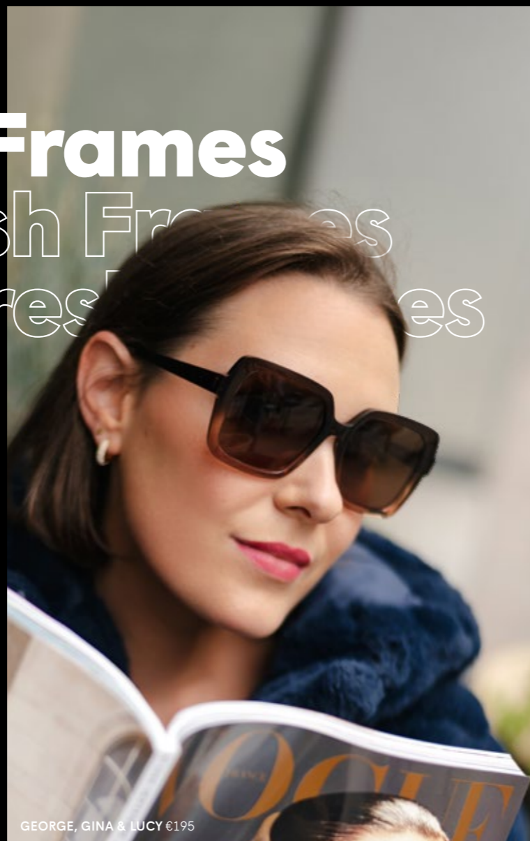
GEORGE, GINA & LUCY €195

Say hi to George, Gina & Lucy , de perfecte keuze voor dames die op zoek zijn naar een tijdloze en betaalbare zonnebril.