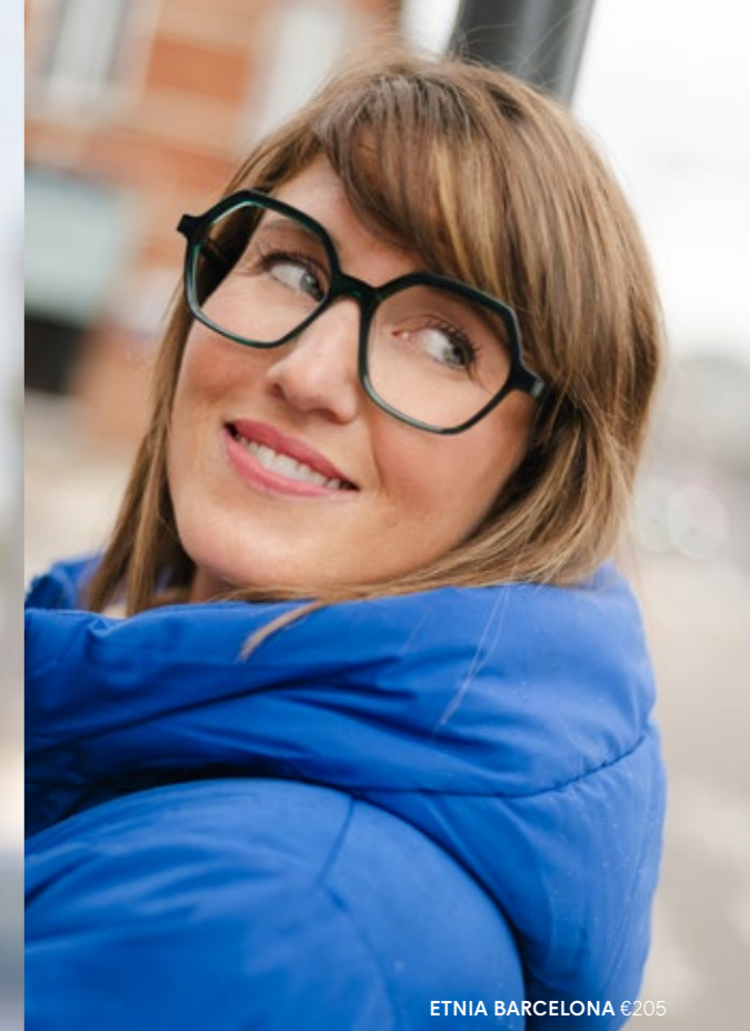
ETNIA BARCELONA €205