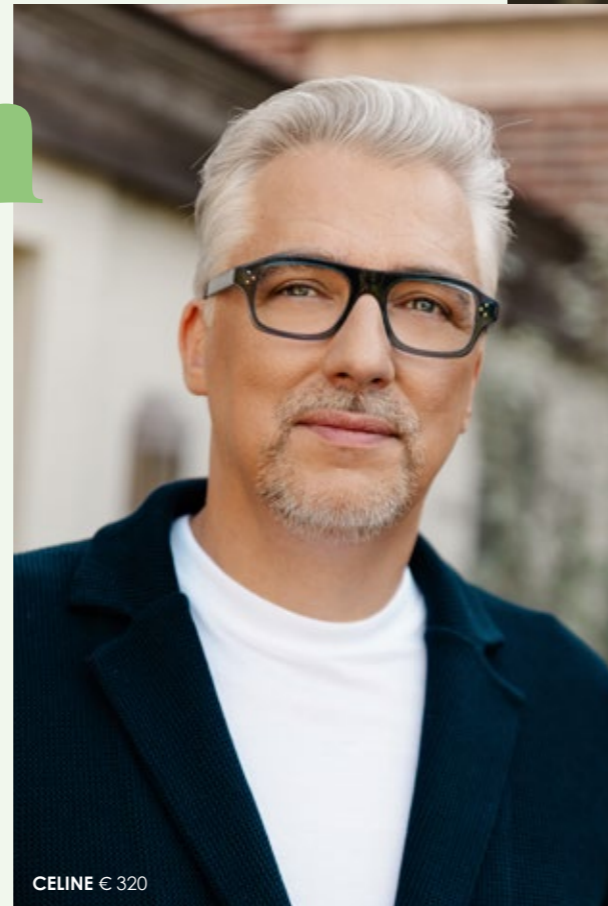
CELINE € 320

De groene (zonne)bril, een must-have accessoire voor de winter van 2023. Let maar op de rijke variatie aan groentinten, van diep smaragdgroen tot zacht olijfgroen of intens appelblauwzeegroen. De kleur zorgt voor een frisse en elegante uitstraling.