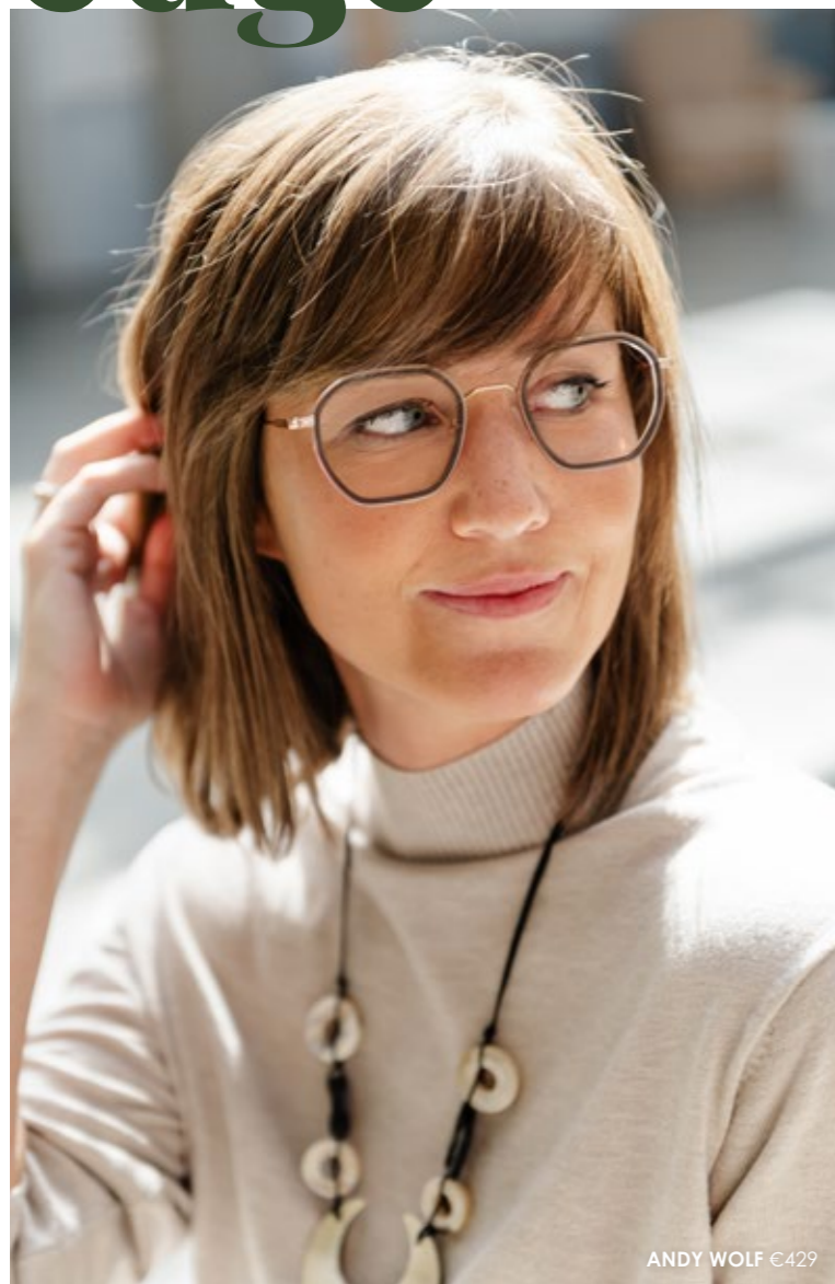
ANDY WOLF C429

Deze brillentrend verovert langzaam jullie harten. En terecht, want hij past bij heel wat gezichtsvormen.