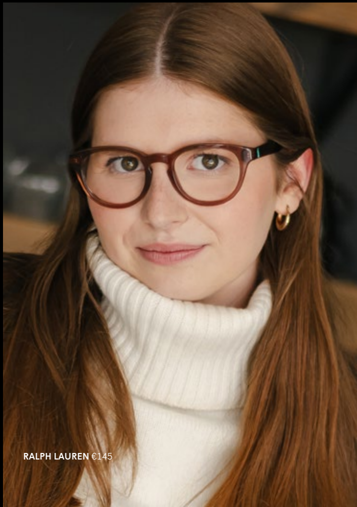
RALPH LAUREN €145