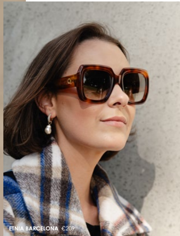
ETNIA BARCELONA €209